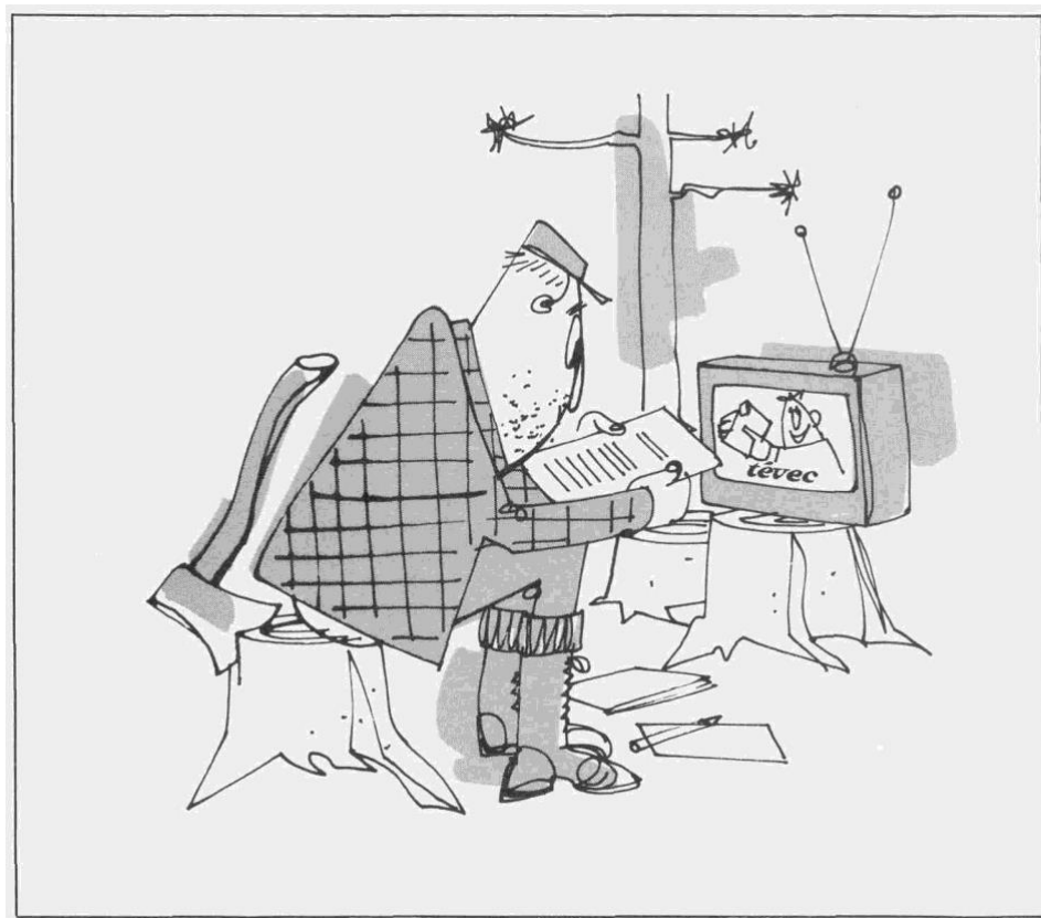
Illustration de BERTHIO

d'expression des gens sur leur situation. TÉVEC, c'est peut-être ainsi une fabrique de vedettes locales, mais TÉVEC c'est d'abord, pour les adultes de la région, vivre un nouveau phénomène social : les communications de masse.