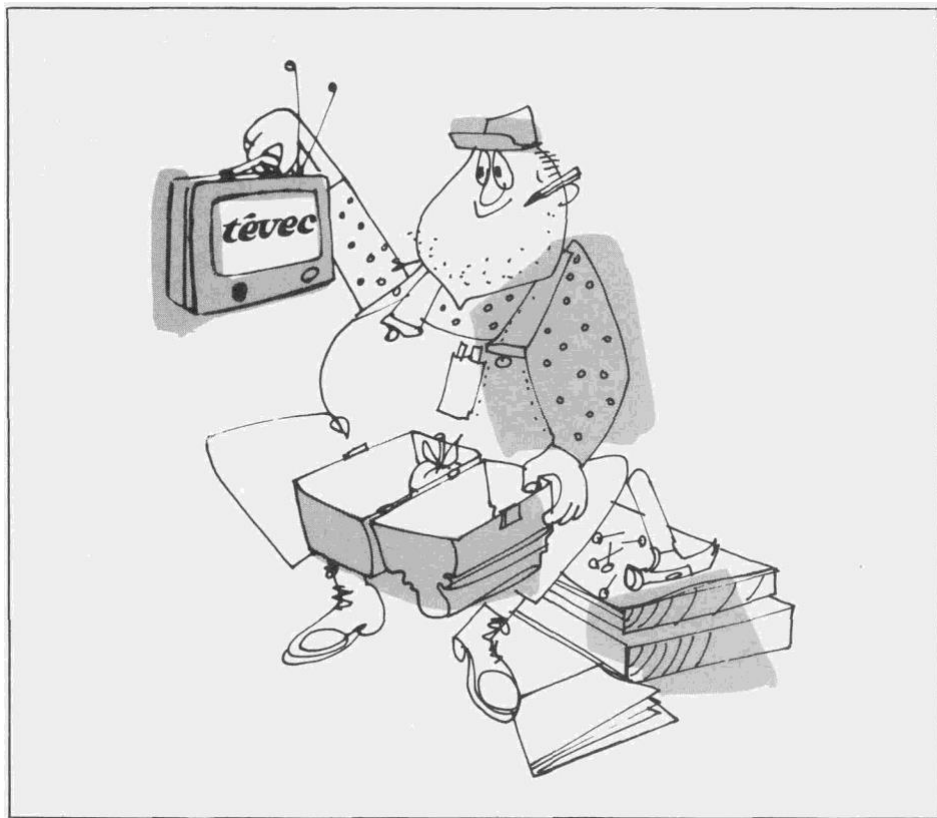
Illustration de BERTHIO

Ce circuit de base est complété par l'organisation progressive de l'animation sociale en une structure de consultation, à partir du regroupement des comités locaux au niveau de chacun des quatre secteurs, puis ensuite dans un comité consultatif régional appelé à se prononcer à la fois sur le contenu des émissions, comme par exemple sur le choix des thèmes socio-économiques, et sur les modes de réalisation des objectifs du projet. C'est ici le lieu privilégié de l'animation sociale à TÉVEC : il s'agit de favoriser d'abord, en matière d'expérience de la participation, l'apport des individus et des groupes à ce moyen unique de communication que représente en notre société moderne la télévision. Dans les émissions de TÉVEC, c'est en premier lieu la population du Saguenay-Lac Saint-Jean qui prend la vedette, de sorte que la technique (choix des thèmes, tournage en location, participation de l'auditoire-studio, etc.) est au service des possibilités