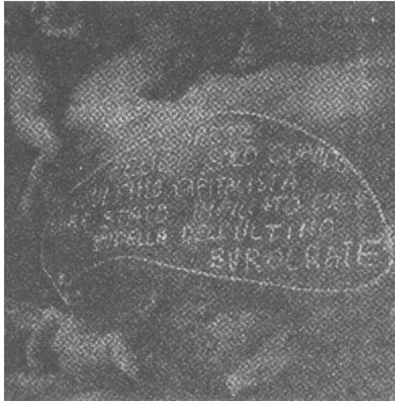
INSCRIPTION SUR LES FRESQUES DE L'UNIVERSITÉ DE GÈNES (1969)

elle-même les 95 % des arrêts du travail constitués désormais en Angleterre par les grèves sauvages. En août, la grève sauvage gagnée après huit semaines par les fondeurs des aciéries de Port-Talbot « a prouvé que la direction du T.U.C. n'est pas armée pour ce rôle » ( Le Monde , 30-8-69).