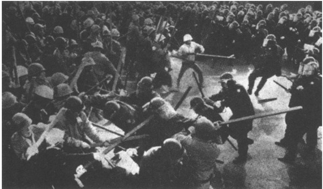
LA ZENKAKUREN EN 1968

Dans les mois suivants, les mouvements « sauvages » chez Fiat et parmi les ouvriers du nord, plus que la décomposition achevée du gouvernement, ont montré à quel point l'Italie est proche d'une crise révolutionnaire moderne . Le tour pris en août par les grèves sauvages de la Pirelli de Milan et de Fiat à Turin signale l'imminence d'un affrontement total.