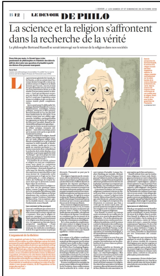
Un article publié dans LE DEVOIR, Montréal, édition du samedi, 27 octobre 2018, page B12 – le devoir de philo.