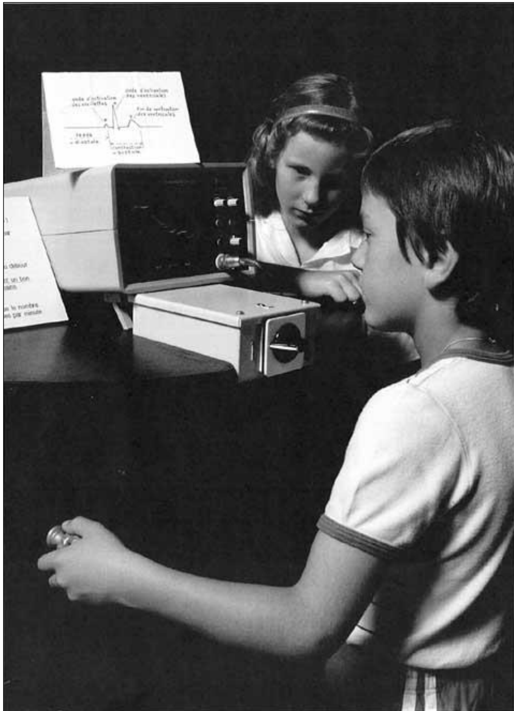
« Comment obtenir soi-même son électrocardiogramme » au Musée Zoologique de Strasbourg.