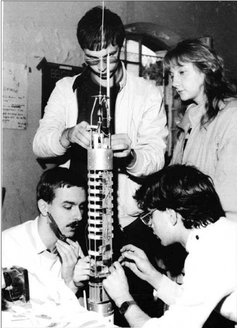
Mise au point d'une fusée expérimentale dans un club Espace.