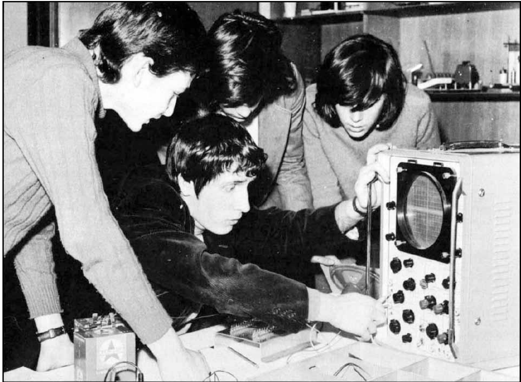
Club Jean Perrin : laboratoire d'électronique.