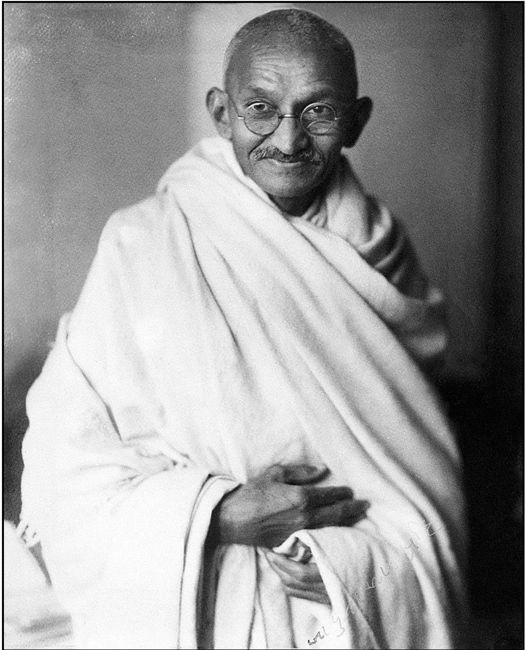
Mohandas Karamchand Gandhi, en septembre 1931.