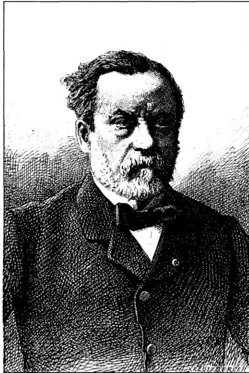
Louis Pasteur (1822-1895). Extrait de la Science Illustrée, IXXX.