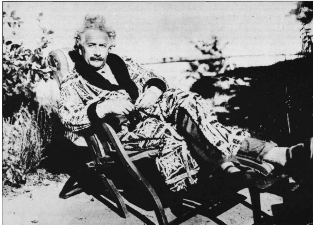
Albert Einstein (1879-1955).

Les réponses des enfants reflètent la présence d'une tension : s'ils reconnaissent majoritairement à l'école un rôle prépondérant en ce qui concerne l'acquisition des savoirs scientifiques (54%), la place accordée à la télévision s'avère importante dans le premier cas (39%) et devient première dès lors qu'il s'agit de l'intérêt que l'on peut éprouver à entendre parler de la science (51% pour la télé contre 43% pour l'école).