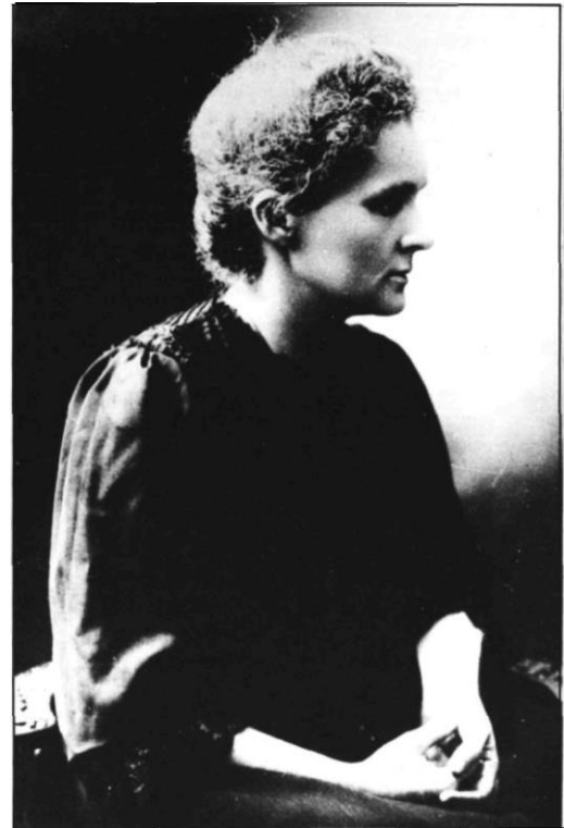
Marie Curie (1867-1934).

Enfin il faut retenir une troisième variation importante en fonction de l'âge : d'une façon générale au fur et à mesure que l'âge augmente l'intérêt pour les matières scolaires et en particulier pour les matières scientifiques diminue. Si 40% des 11-12 ans déclarent s'intéresser beaucoup à la physique, à 15-17 ans, ils ne sont plus que 27%.