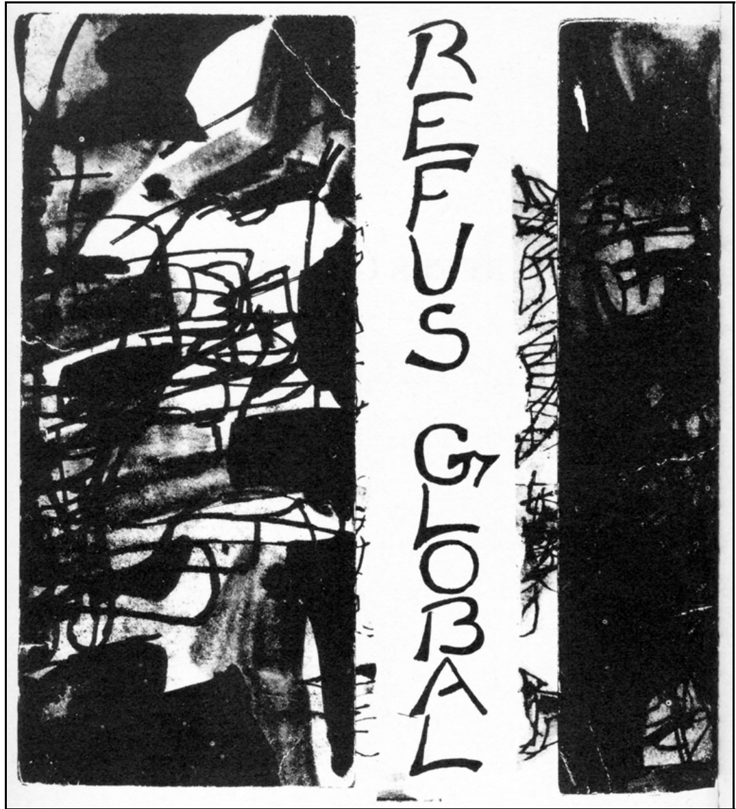
Couverture de l'édition originale de Refus Global , 1948. Maquette de Jean-Paul Riopelle. (Éditions Mithra-Mythe)